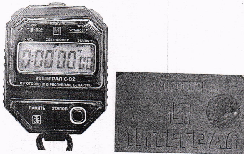
Рисунок 1.1 – Фотографии общего вида и маркировки секундомера электронного «Интеграл С-02» (изображение носит иллюстративный характер)