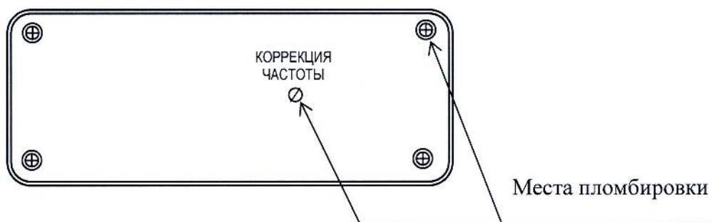
Рисунок 2 – Схема пломбировки частотомеров (вид сзади) от несанкционированного доступа